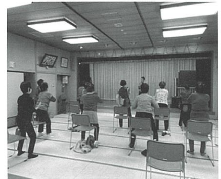
生き生き倶楽部「体操の様子」