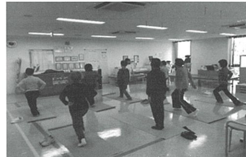
ひざの痛みを和らげる運動教室 「ひざに負担をかけない動作を学ぶ様子」