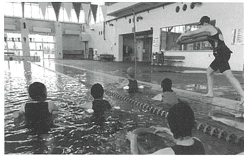
水中ウォーキング教室 「水中での運動を学ぶ様子」