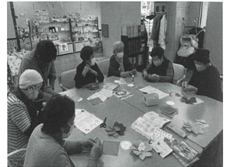
おれんじカフェ ひなた 「折紙の様子」