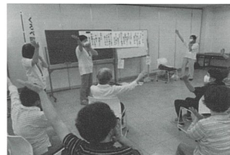
認知症予防教室 たんぼぼ 「脳トレ体操の様子」