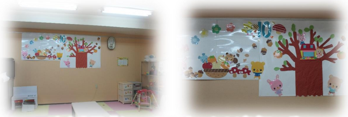
自由空間「かって屋」内 たんぽぽランド

パパママサポートセンター「たんぽぽ」までの位置図 (自由空間かって屋内にあります)