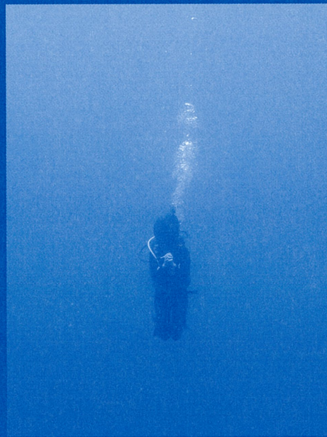
《海の中に祈りを溶かす》 2022~23年 映像