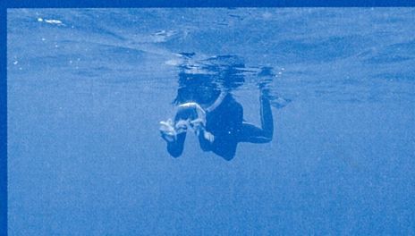
《金魚と海を渡る》 2022年 映像