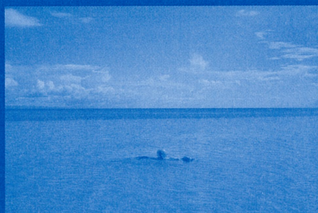
《ため息で浮かぶ》 2022年 映像

キュンチョメ：ホンマエリとナブチによるアーティストユニット。近年の主な展覧会に「六本木クロッシング2022:往来オーライ!」(森美術館 2022)、「現在地:未来の地図を描くために [1]」(金沢21世紀美術館 2019)、「あいちトリエンナーレ2019」(愛知 2019) などがある。kyunchome.com