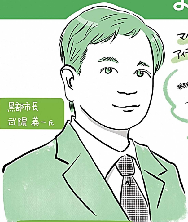
黒部市長 武隈 義一氏