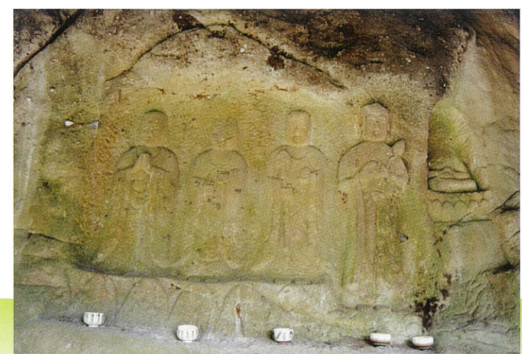
県文化財指定嘉例沢石仏

★嘉例沢の石仏(県指定史跡)は嘉例沢集落より約100m上辺に左右5m、上下5.8mの大きな岩の全面ほぼ中央に5体の仏像が浮き彫りされている。磨崖仏としては大岩の不動につく大きなものです。