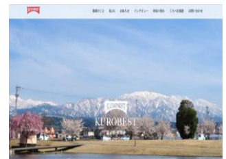
黒部市移住定住サイト