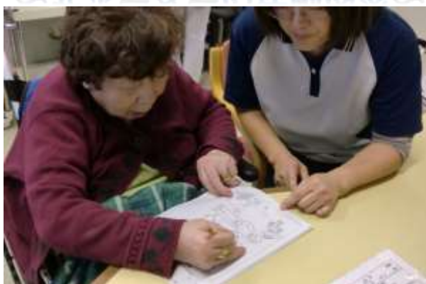
話し相手・レクリエーションの補助