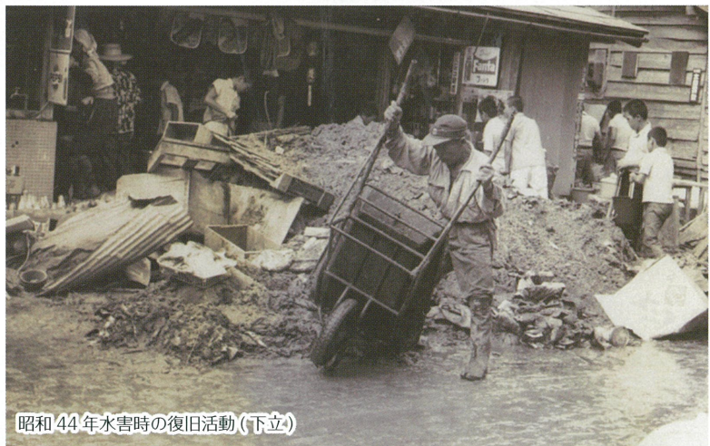
昭和44年水害時の復旧活動(下立)