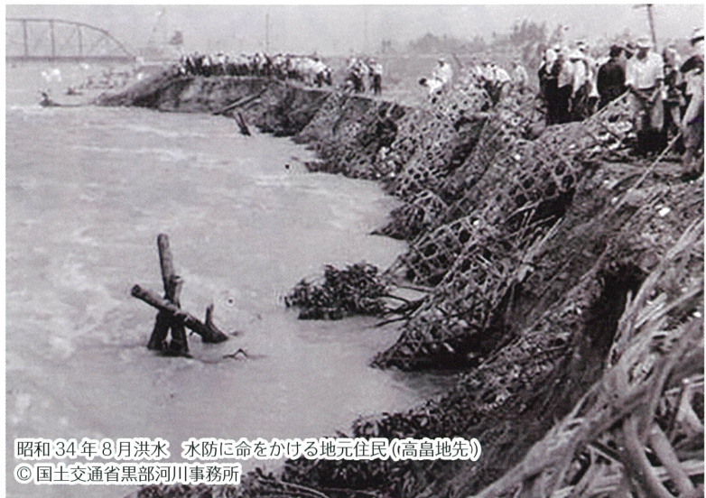
昭和34年8月洪水 水防に命をかける地元住民(高島地先)