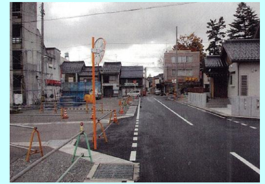
三日市保育所周辺 土地区画整理事業(基幹事業)