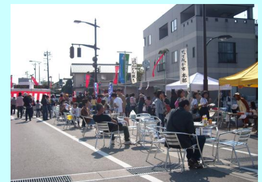
三日市まちなかプロジェクト事業 (関連事業)