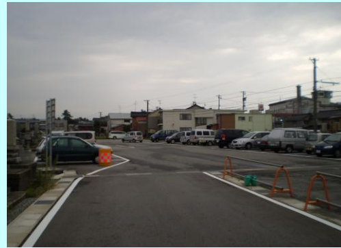
市役所駐車場休日開放 (提案事業)