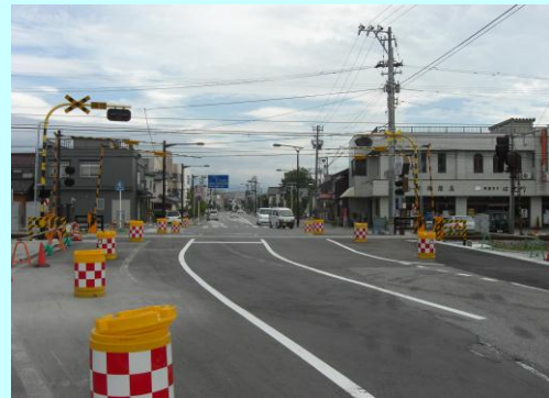
都市計画道路前沢植木線 (基幹事業)