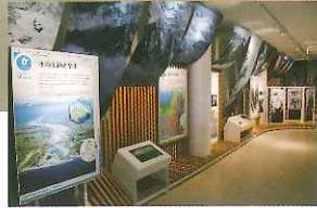
山・川・海の見どころ紹介

この地には、高低差4,000mの自然と豊富な水資源に加え、遙か38億年の過去から現在までの地球規模の大地の営みが刻まれています。山・川・海のもつ様々な魅力や、雪と水で繋がる自然と文化を体感できる展示空間です。日本ジオパーク「立山黒部」拠点施設