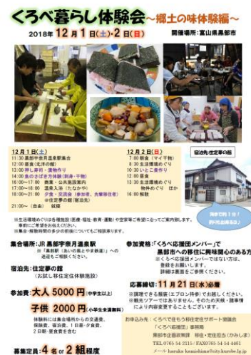
暮らし体験会チラシ