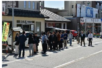
学生等の地域活動参画