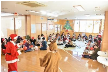
子育て支援センター