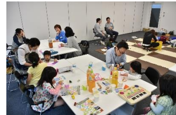
移住者コミュニティの活動