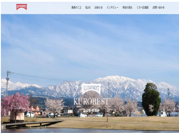
市移住定住サイト