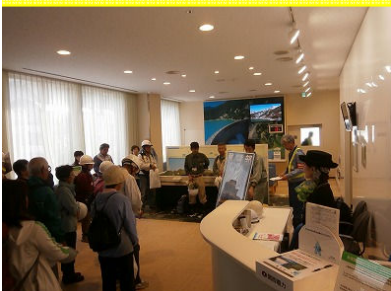
黒部川電気記念館で 先人の偉業に触れる!