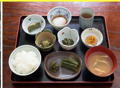
黒薙温泉名物 「山菜定食」に舌鼓

黒部川開発100年を記念して、普段見ることのできない宇奈月温泉の源泉「黒薙温泉」の噴泉を見学するツアーです。さらに、普段立ち入れない「新黒薙第二発電所」も見学できます!