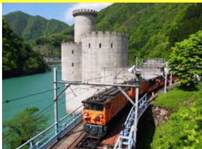
涼を求めて… 黒部峡谷トロッコ電車!