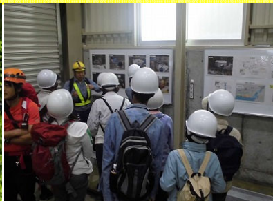
新黒薙第二発電所見学で 新技術見学!